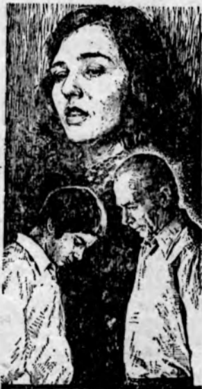
ПОЛКОВНИК В ОТСТАВКЕ

Фильм «Полковник в отставке» будет идти на экранах города 16 и 17 марта.